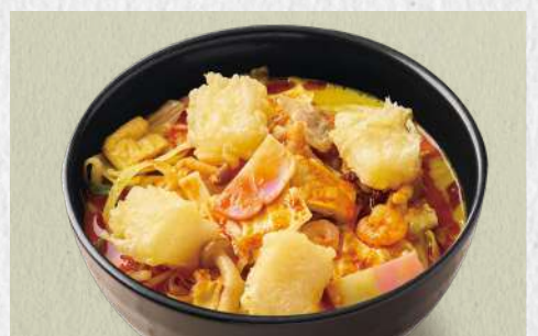
ちゃんぽんカレーうどん 辛吉+揚げ餅