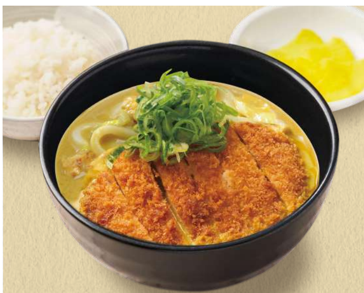
千吉カレーうどん カツのせ 1,310円