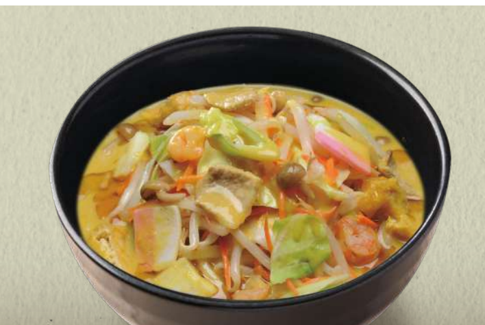
ごま油の香ばしさが味を引き立てる逸品 野菜たっぷり ちゃんぽんカレーうどん