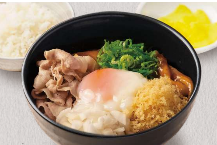
20種類以上のスパイスと薬味が絶妙 まぜカレーうどん (ごはん・香物付)