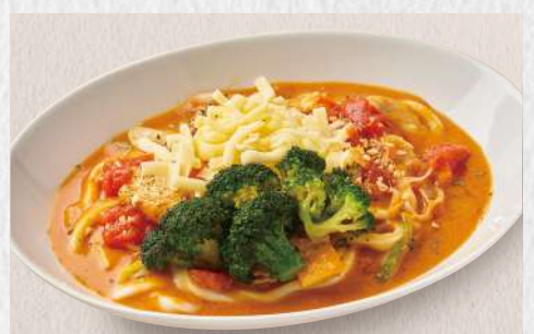
イタリアンカレーうどん チーズ+揚げブロッコリー