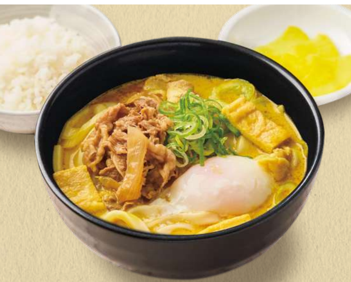
千吉カレーうどん 温玉+肉のせ 1,460円