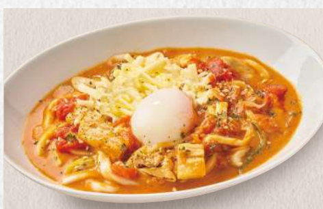
イタリアンカレーうどん チーズ+温玉