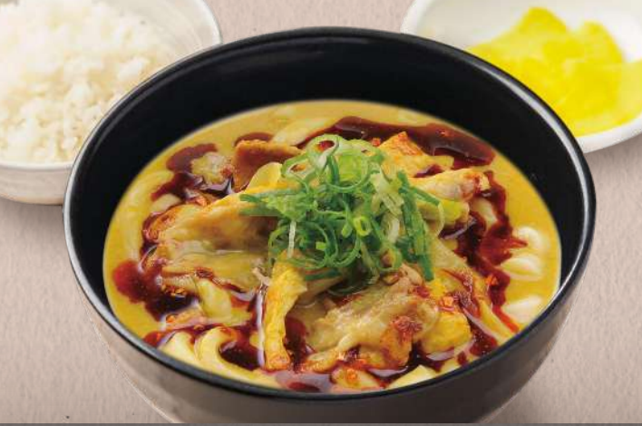
オリジナルベースのピリ辛仕立て 辛吉カレーうどん (ごはん・香物付)

三十種類以上の香辛料と、こだわりの出汁、こだわりの麺。千吉自慢の逸品を是非ご賞味ください。