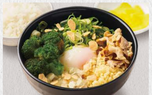
まぜカレーうどん 揚げニンニク+揚げブロッコリー