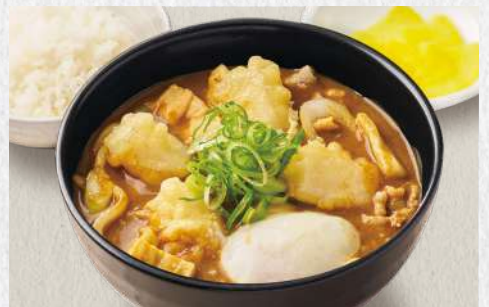
ビーフカレーうどん 温玉+揚げ餅