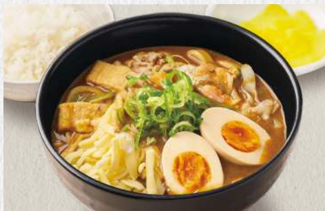
ビーフカレーうどん チーズ+味付け玉子