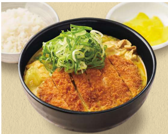
千吉カレーうどん 青葱+カツのせ 1,460円