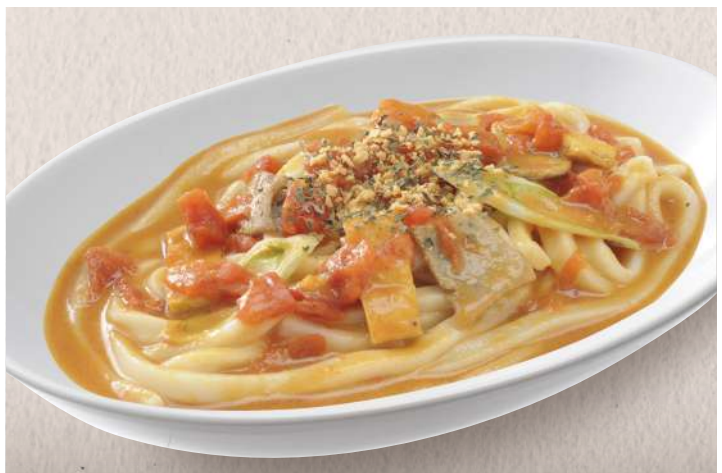
トマトの酸味が効いた新感覚 イタリアンカレーうどん