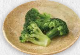
揚げブロッコリー