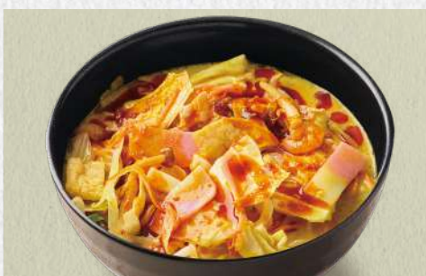
ちゃんぽんカレーうどん 辛吉