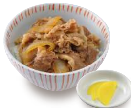
牛丼セット +390円 単品 440円