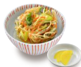
野菜かき揚げ丼セット +290円 単品 340円