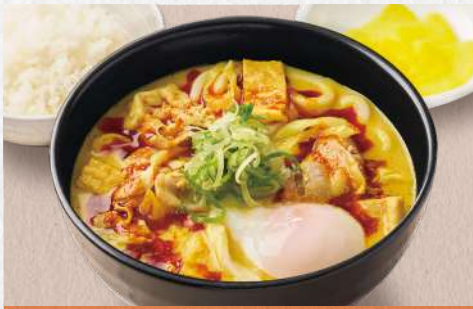
辛吉カレーうどん 温玉