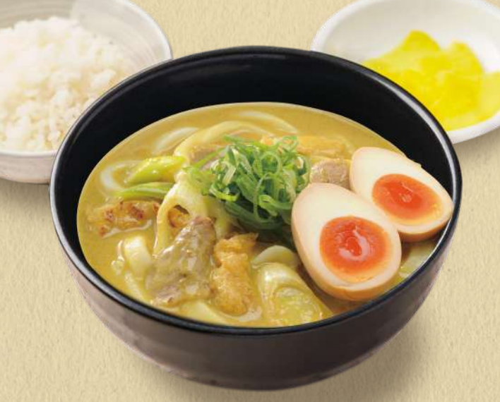
千吉カレーうどん 味付け玉子 1,070円