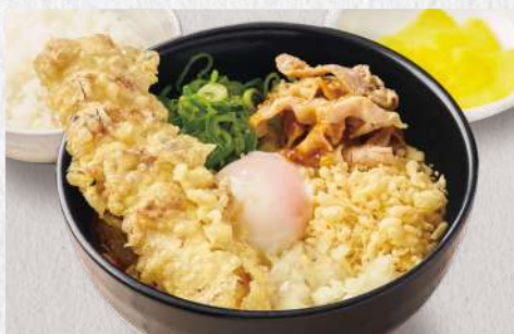
まぜカレーうどん ちくわ天