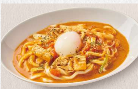
イタリアンカレーうどん 温玉