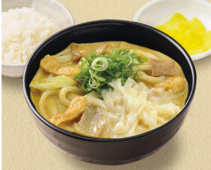
千吉カレーうどん チーズ 1,070円