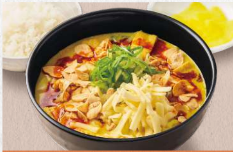
辛吉カレーうどん チーズ+揚げニンニク