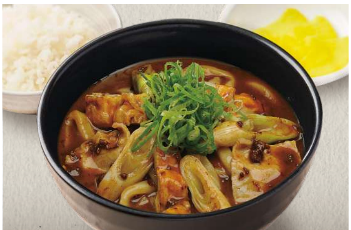
ビーフのコクと旨味が効いたカレーソース ビーフカレーうどん (ごはん・香物付)