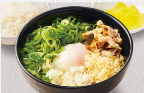
まぜカレーうどん 青葱