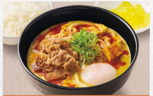
辛吉カレーうどん 温玉+肉のせ