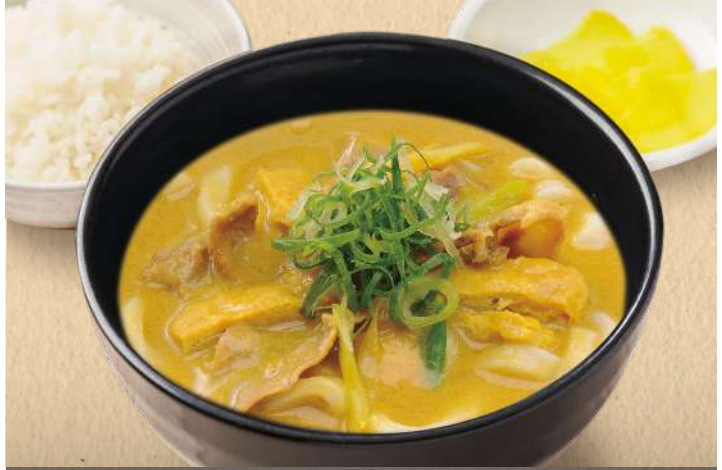
和風だしにミルクを加えたオリジナル 千吉カレーうどん (ごはん・香物付)