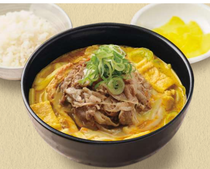
千吉カレーうどん 肉のせ 1,310円