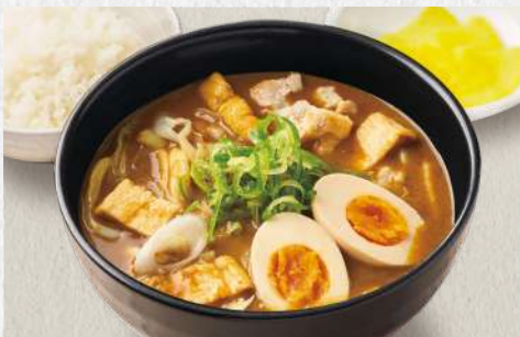
ビーフカレーうどん 味付け玉子